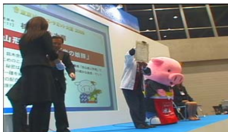
第23回 東京ビジネスサミット2009