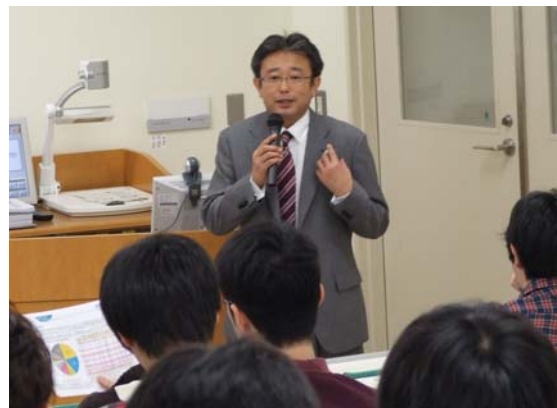
講師派遣による講義の開催