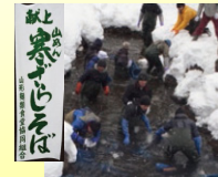
←大寒が 寒ざらしそばの 冷水処理作業日。

寒ざらし玄そばを製粉したそば粉で打ち上げたそばで、冷水に浸すことでアクが抜け、また寒風にさらすことで舌触りも良く、甘みと淡白な味わいのあるそばになります。山形では、4月中旬から5月上旬ごろまで賞味できます。 ※寒ざらし玄そば：秋に収穫した新そばを、細心の注意をはらいながら保存し厳寒の冷たい清流に10日ほど漬けておきこれを引き上げ、山国の寒い風と真冬の紫外線の多い太陽光線でさらして乾燥するという手間のかかった玄そばです。