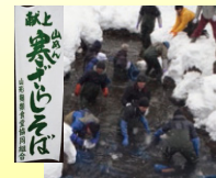
←大寒が 寒ざらしそばの 冷水処理作業日。

寒ざらし玄そばを製粉したそば粉で打ち上げたそばで、冷水に浸すことでアクが抜け、また寒風にさらすことで舌触りも良く、甘みと淡白な味わいのあるそばになります。山形では、4月中旬から5月上旬ごろまで賞味できます。 ※寒ざらし玄そば：秋に収穫した新そばを、細心の注意をはらいながら保存し、厳寒の冷たい清流に10日ほど漬けておきこれを引き上げ、山国の寒い風と真冬の紫外線の多い太陽光線でさらして乾燥するという手間のかかった玄そばです。